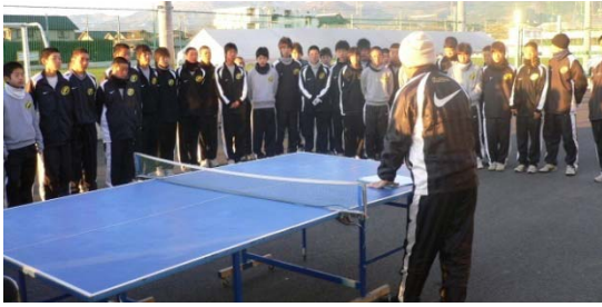
眠い目をこすりながら入念な打ち合わせ。 みんなしっかり頼んだぞ！！