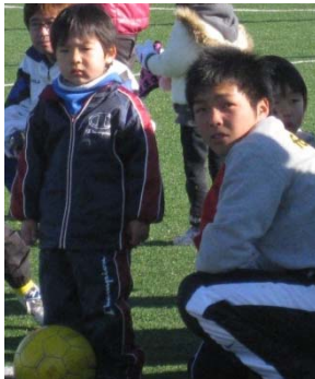
ふたり…どこを見てるの？